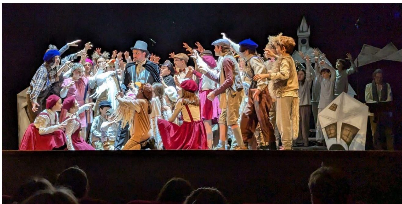
Foto tratta dallo spettacolo "Brundibar" andato in scena al Teatro Sociale di Sondrio il 27 gennaio 2025

Bilancio sociale predisposto ai sensi dell'art. 14 del decreto legislativo n. 117/2017